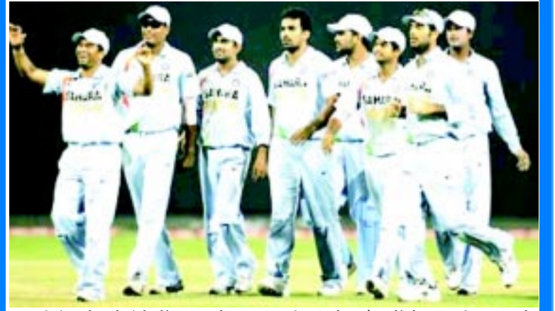
श्रीलंका के कोलंबो में हुए दूसरे एक दिवसीय क्रिकेट मैच में मेहमान टीम भारत ने मेजबान श्रीलंका को 15 रनों से हराकर पांच मैचों की सीरीज में 2-0 से बढ़त ले ली है।